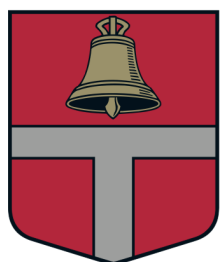
Vidrižu pagasta ģerbonis