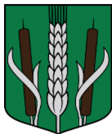
Skultes pagasta ģerbonis