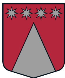
Viļķenes pagasta ģerbonis