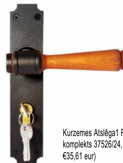
Kurzemes Atslēga1 Rokturu un uzliku komplekts 37526/24, melns, (cena ~€35,61 eur)

Ēkas Burtnieku ielā 2, Limbažos, pagrabstāva daļas vienkāršotās atjaunošanas projekta (aplīdzinājuma kartes) izstrāde