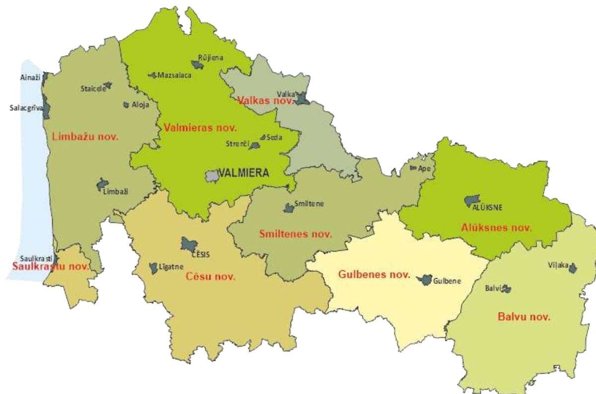
Attēls 2-1 Vidzemes AAR – administratīvi teritoriālais iedalījums